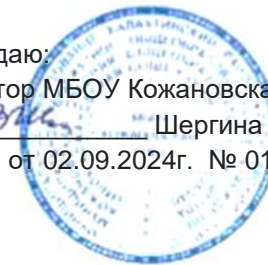
График контрольных работ в 1-4 классах