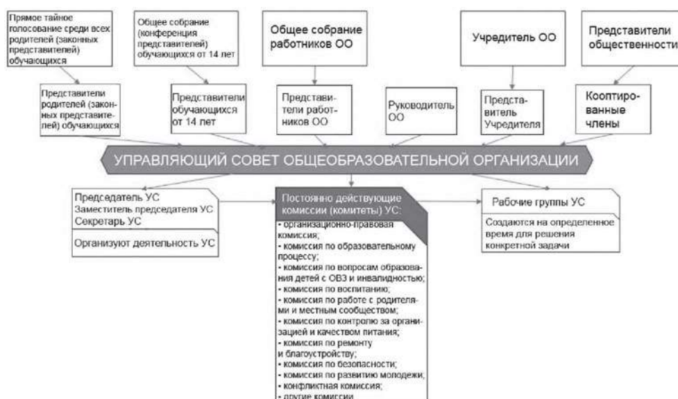
Рис. 1. Модель N 1 - "Управляющий совет общеобразовательной организации" (УС ОО)

Предлагаемая модель управляющего совета образовательной организации рассчитана на образовательные организации, реализующие образовательные программы начального общего, основного общего и среднего общего образования, которые располагаются в одном здании или в нескольких территориально разделенных структурных подразделениях.