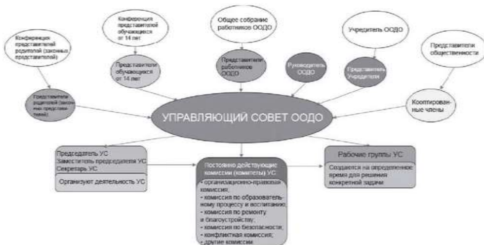
Рис. 2. "Управляющий совет образовательной организации дополнительного образования" (УС ООДО)

Модель N 3 - "Управляющий совет дошкольной образовательной организации" (УС ДОО) (см. рис. 3 ).